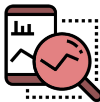
Inteligencia Empresarial y Analítica