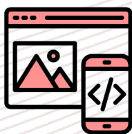
Sitios, Aplicaciones y Servicios Web

EROCA Soluciones Inteligentes te ofrece el desarrollo de Software a medida, adaptándonos a tus necesidades de digitalización a fin de mejorar la competitividad de tu negocio